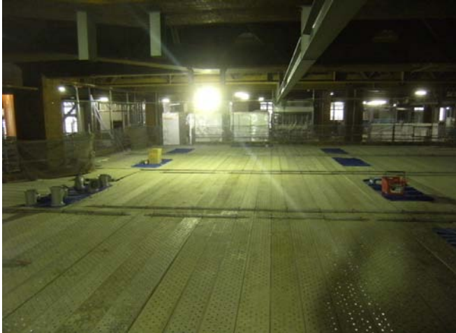
棚足場上部 材料配置状況