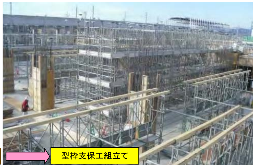
型枠支保工組立て