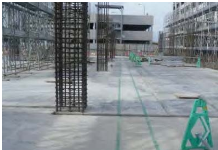
作業通路の先行表示