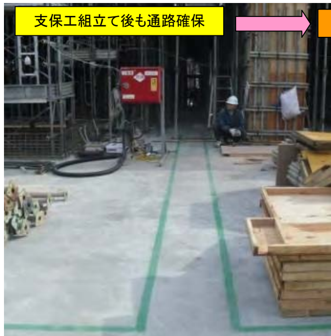
支保工組立て後も通路確保