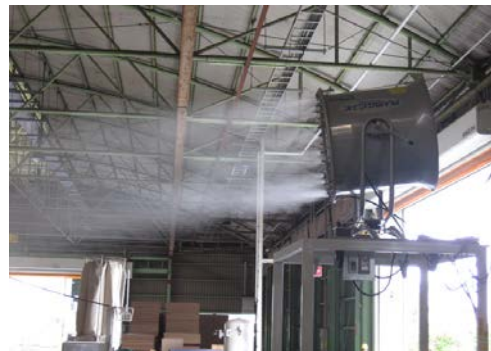
第2工場 1F床、2F床、カバーストレートヤード