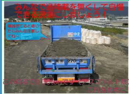
アスファルト殻積載状況