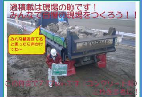
コンクリート殻積載状況