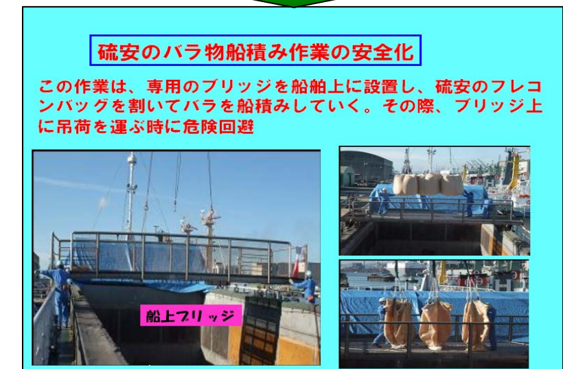
安全帯を掛けて転落防止