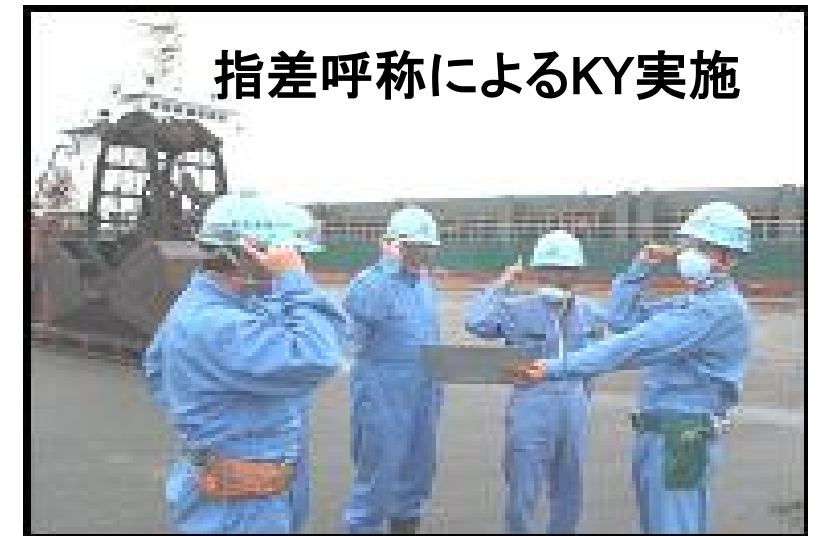
指差呼称によるKY実施

安全活動・災害情報を映像表示して安全活動の『見える化』を実施。定期的に内容を変更し常に最新情報を全員