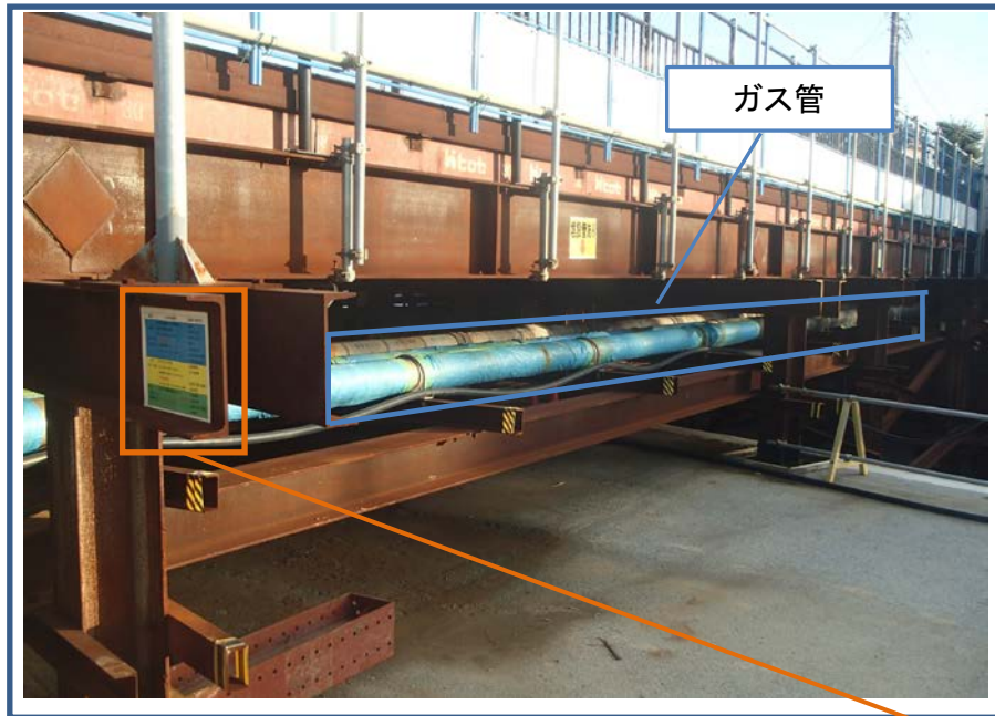
「埋設管あり」の表示