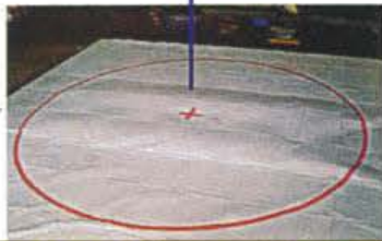
退避距離サークル(直径4m)