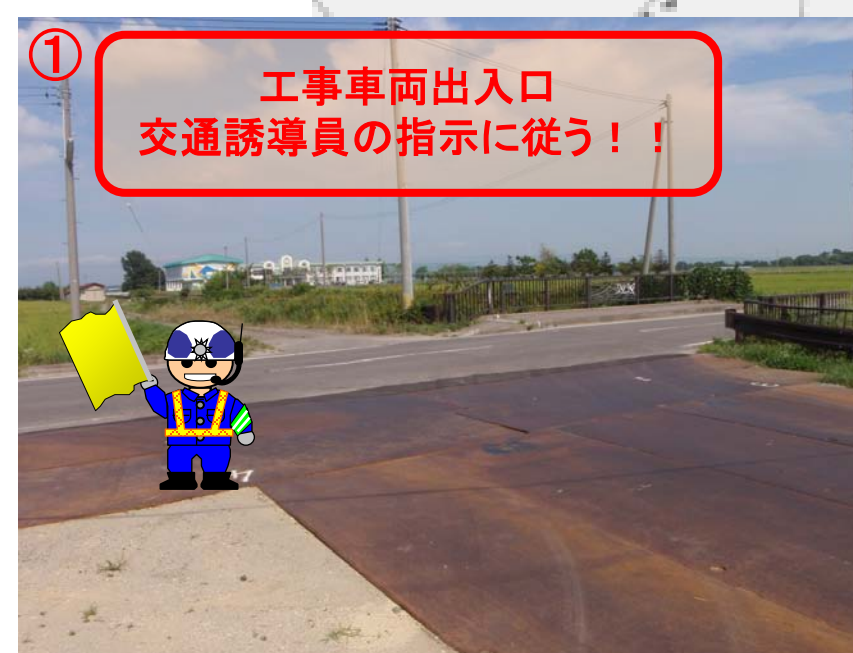
① 工事車両出入口 交通誘導員の指示に従う!!