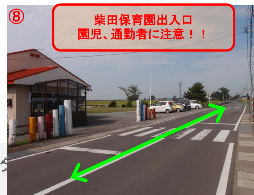
⑧ 柴田保育園出入口 園児、通勤者に注意!!