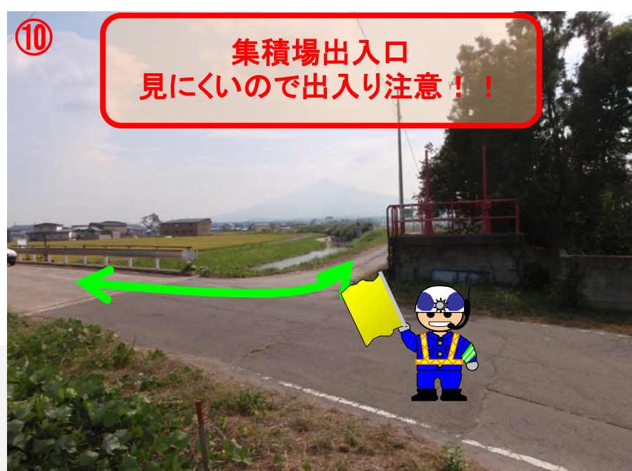
⑩ 集積場出入口 見にくいので出入り注意!!