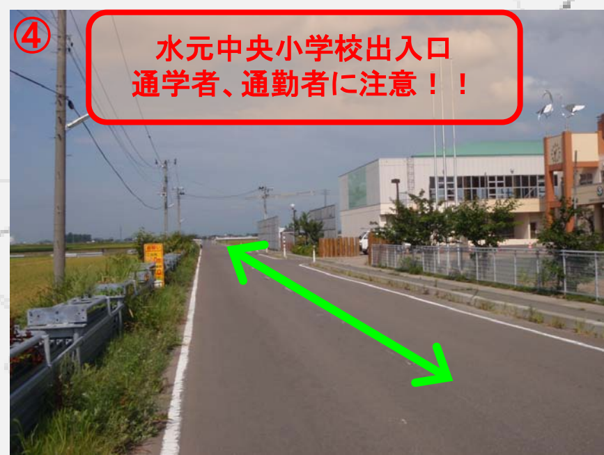
④ 水元中央小学校出入口 通学者、通勤者に注意!!