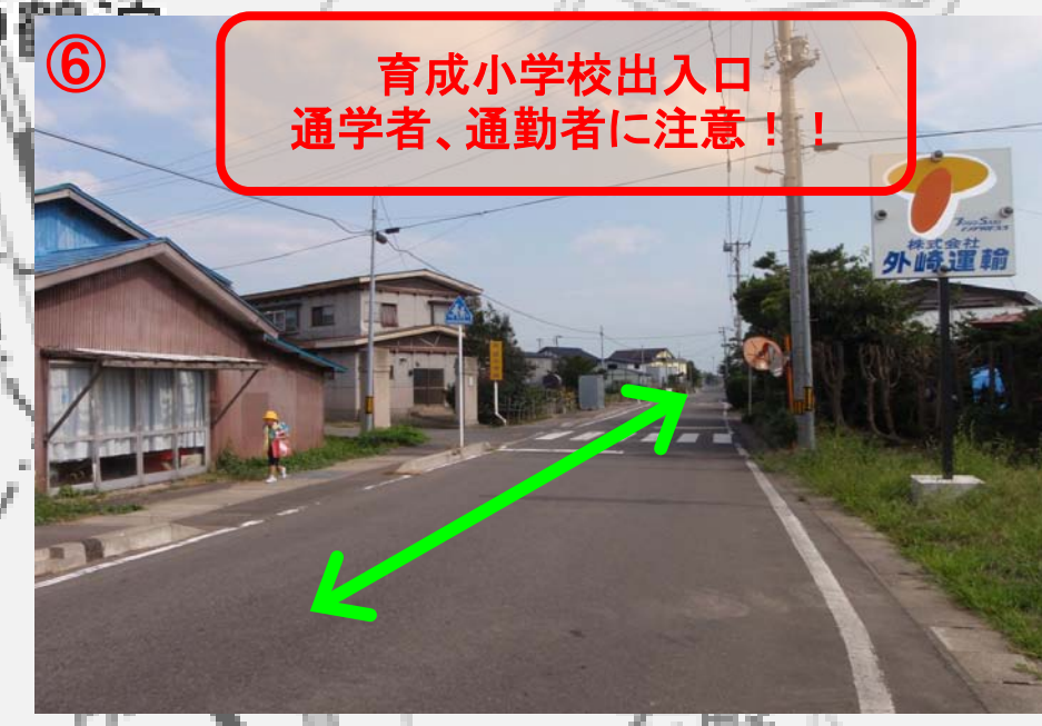
⑥ 育成小学校出入口 通学者、通勤者に注意!!