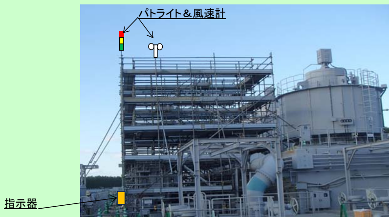
パトライト・風速計・指示器設置箇所