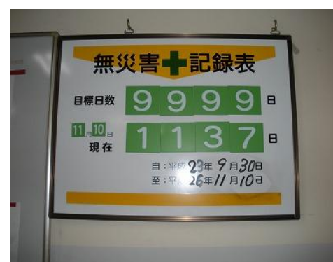
④『無災害記録表』ボード (1137日無災害)掲示の