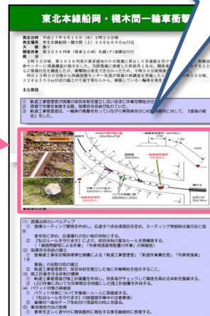
事故概況・説明図・対策をパネル内に記載。