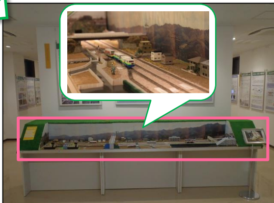
事故の状況をジオラマ（鉄道模型）で再現！事故当時の列車の動きが見えるように。