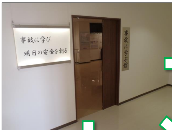
「事故に学ぶ館」の入口