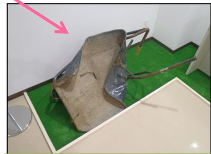
事故当時の実物を展示し、過去の過ちを見える化。