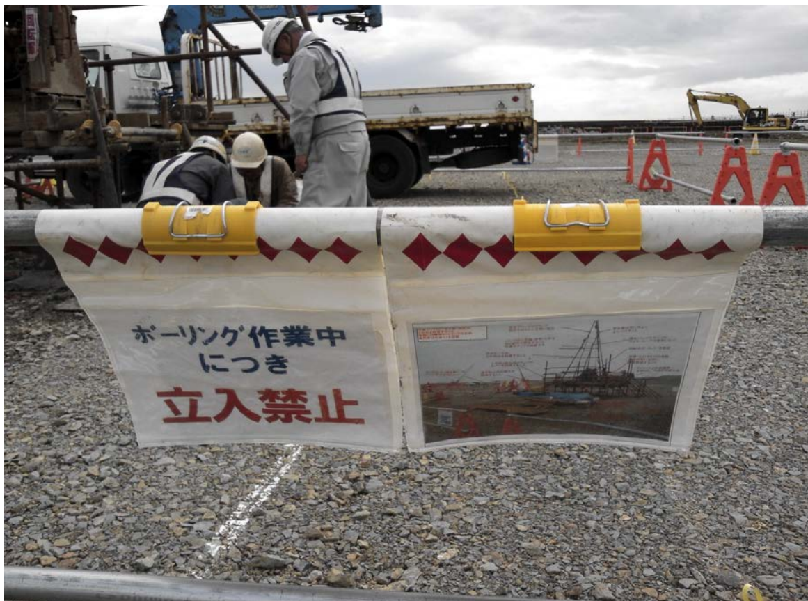
写真-1 安全なボーリング足場の図示