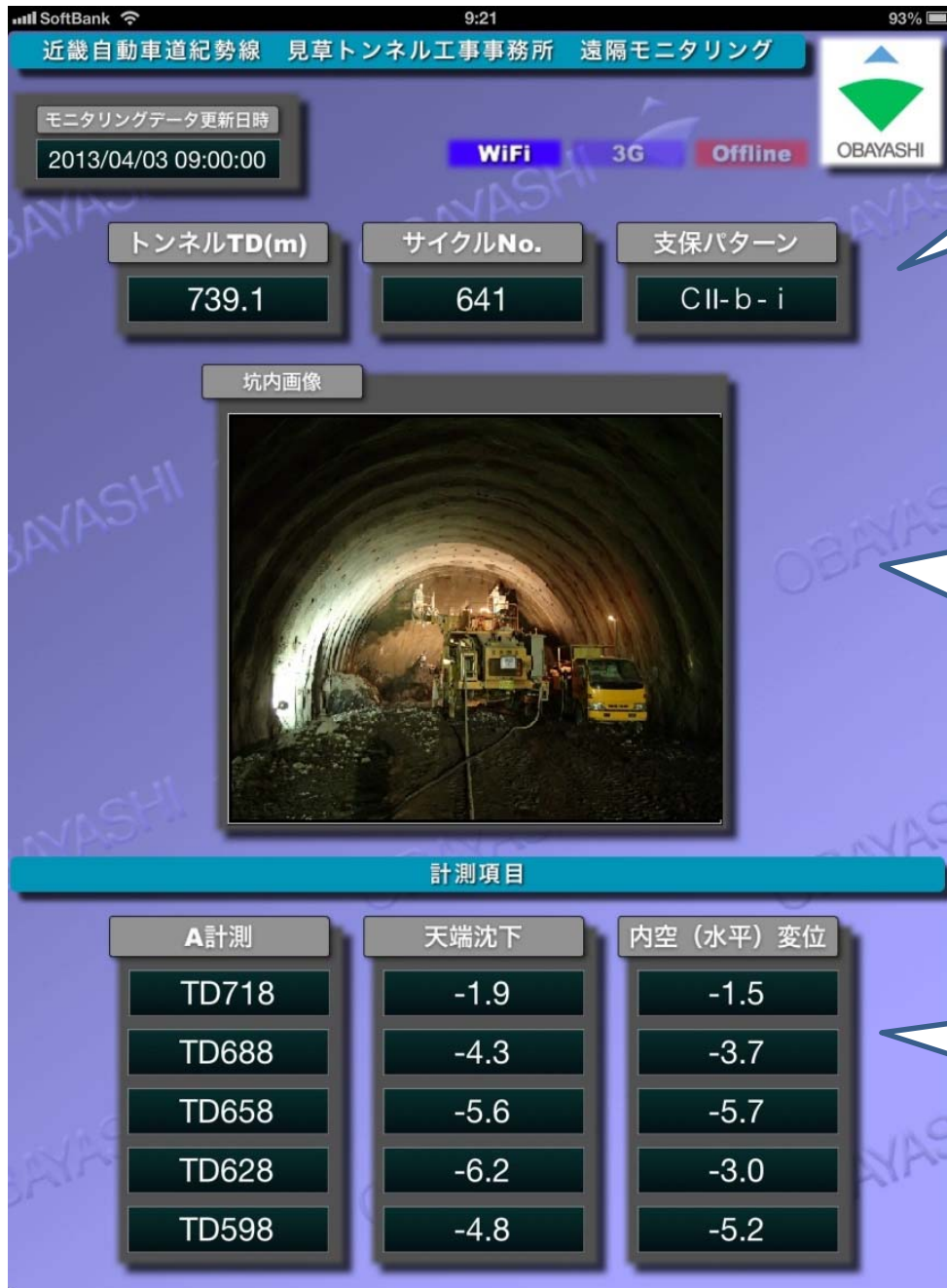
タブレットメイン画面