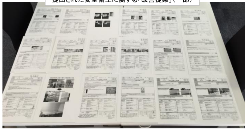
提出された安全衛生に関する「改善提案」(一部)

後日、優良改善の提案者の表彰を行いました。全従業員の安全意識向上に繋がるよう、今後も継続的に活動を行っていきます。