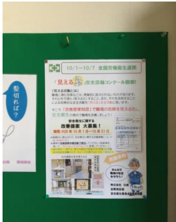
ドライバー点呼場