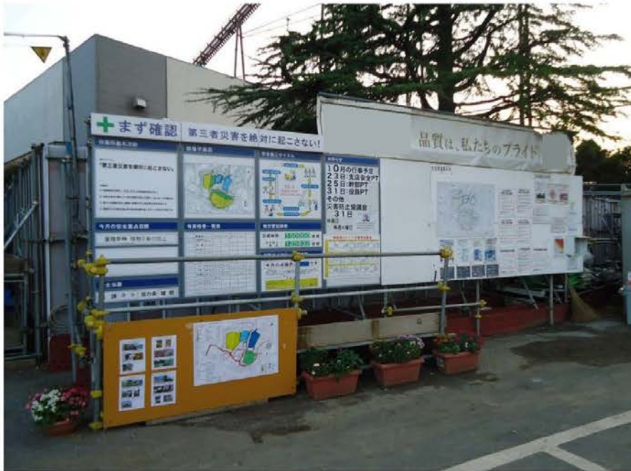
写真1 現場案内図掲示状況