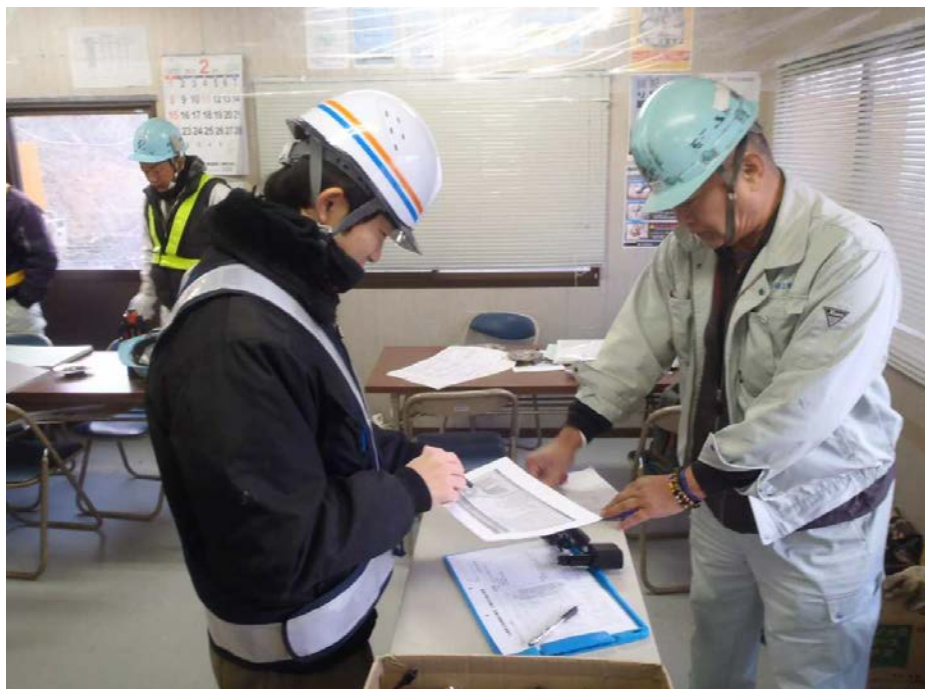
運転手へのアドバイス状況