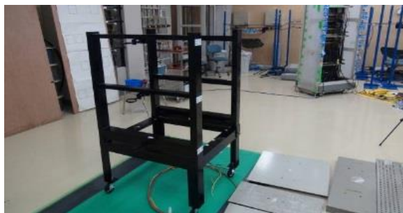
二重床落下実験装置の外観