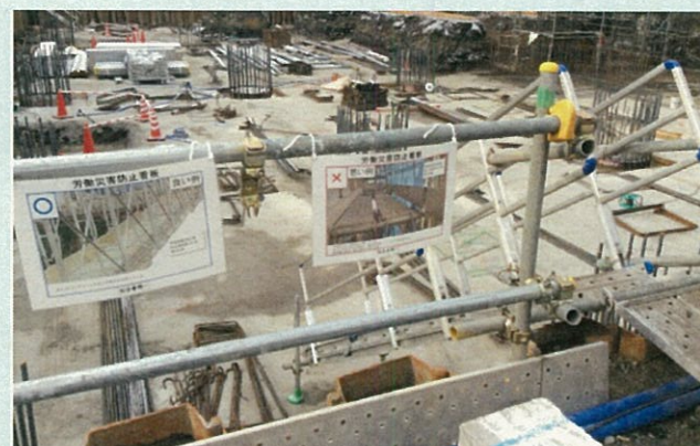
労働災害防止看板