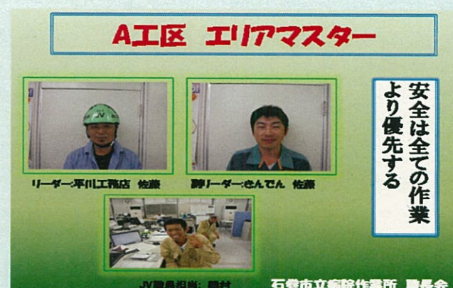
エリアマスター・70Pマスターの表示