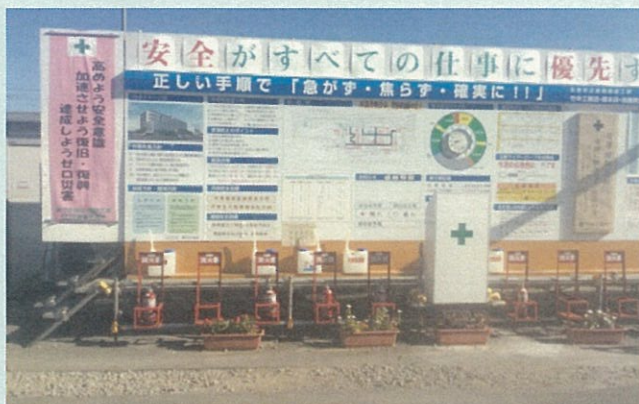
朝礼看板と消火施設