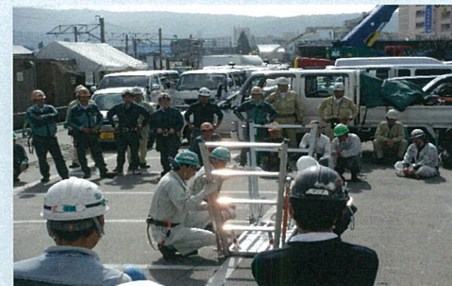
立馬適正使用講習会