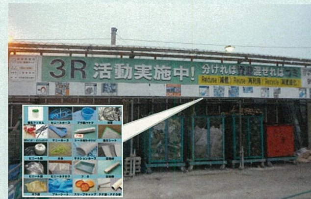
分別ヤードの見える化