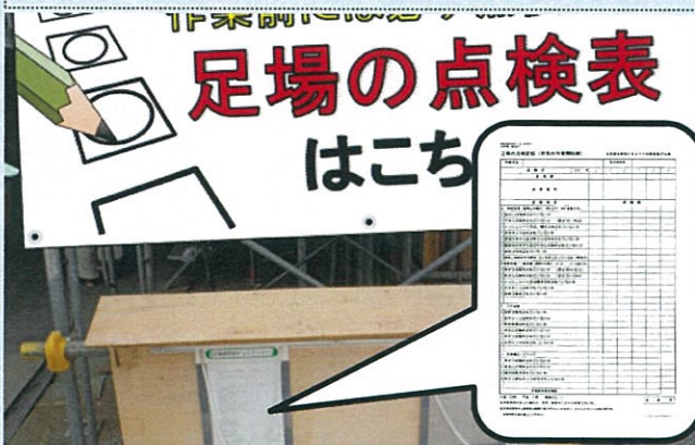
足場使用前点検表