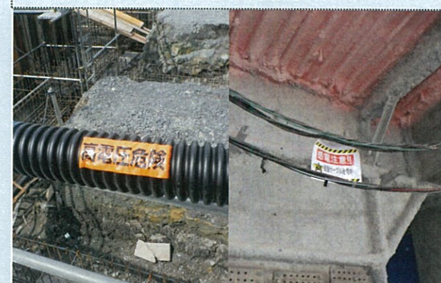
高圧線の注意喚起