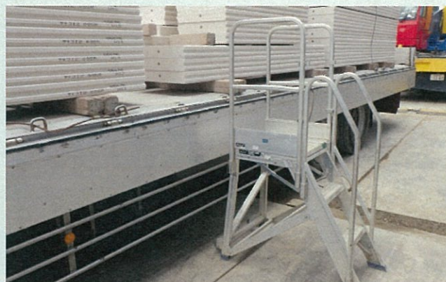
荷台の昇降ステップ