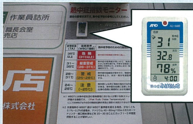
熱中症対策の見える化