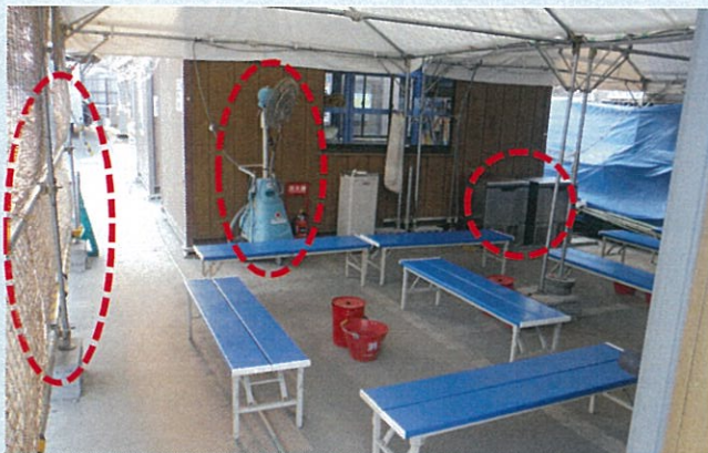
熱中症対策スペース (ミスト扇風機・製氷機・すだれの設置)