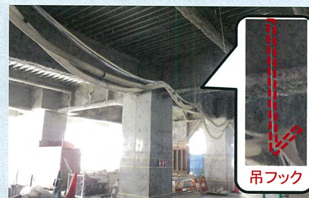
地這配線撲滅の為の 吊フック使用