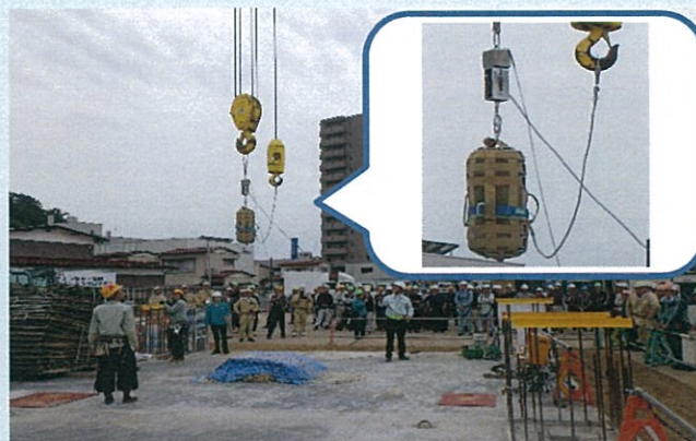
安全帯適性使用講習会