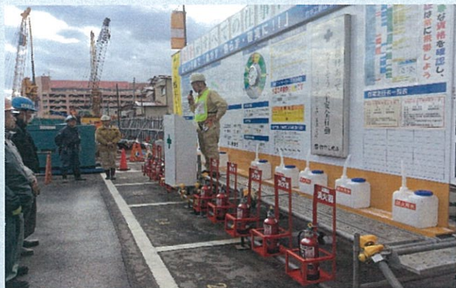
東京本店安全部長講話