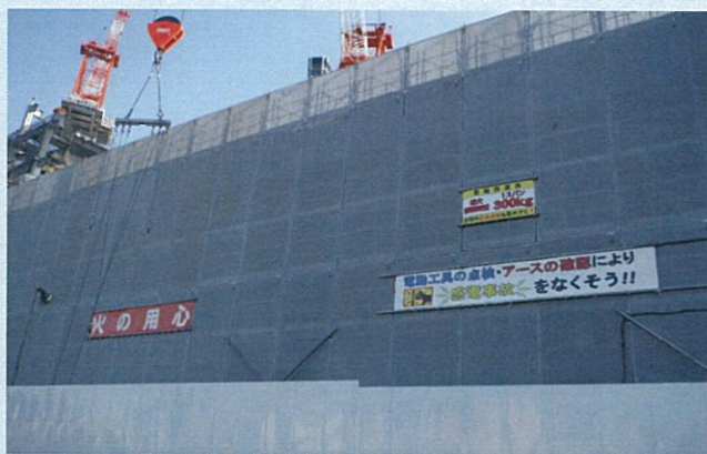
外部足場の注意喚起看板