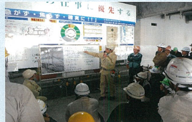
火災事故防止講習会