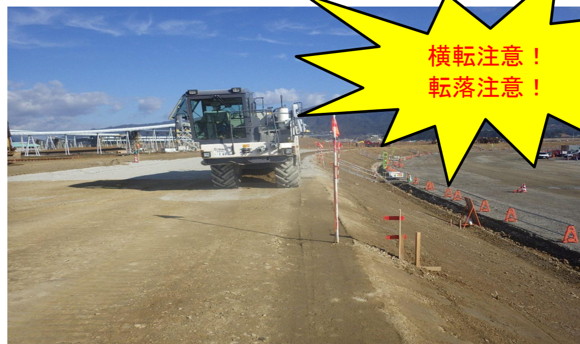
路肩に 寄り過ぎない