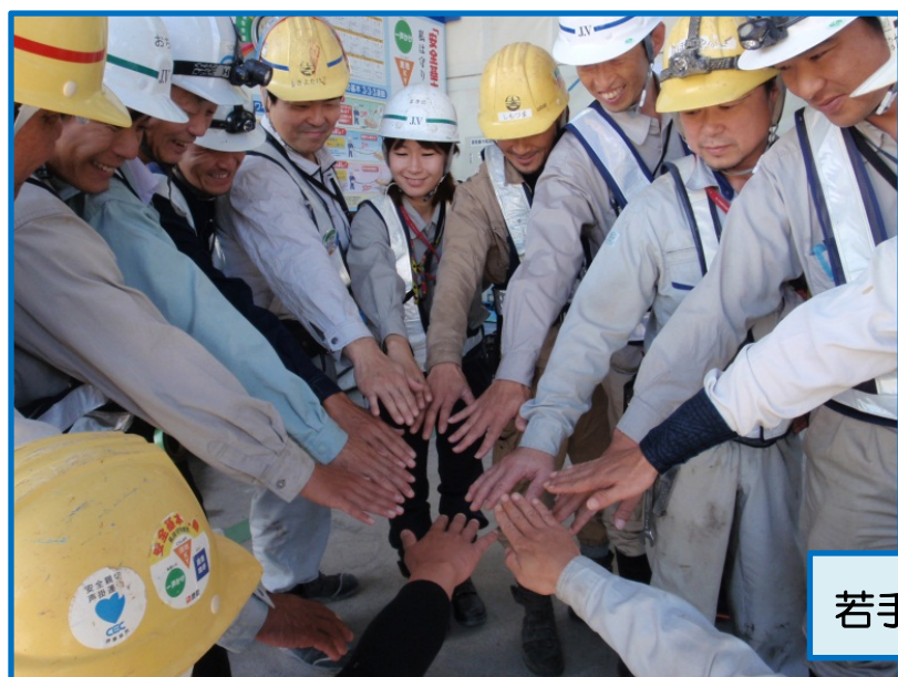
若手社員と Keyman との意志統一!