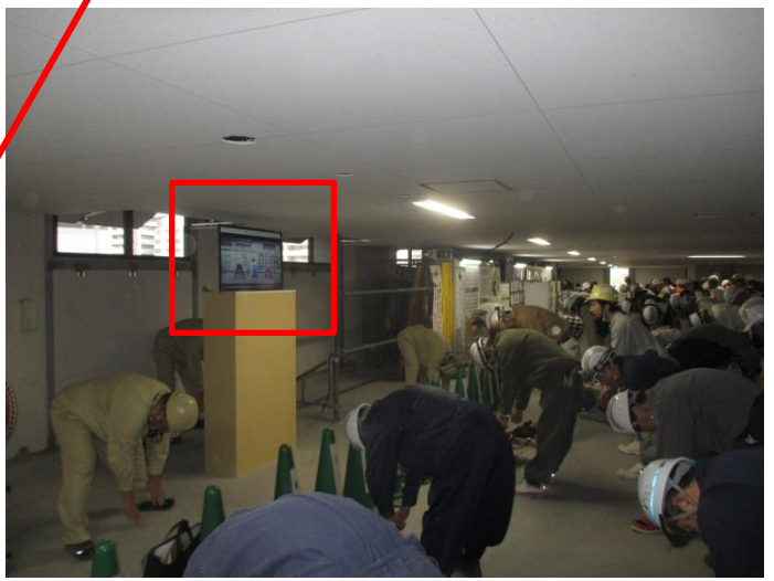
オリジナルラジオ体操にあわせた状況