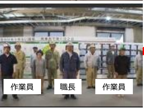
オリジナルラジオ体操動画