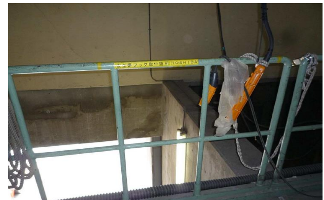
安全帯フック取り付け場所の識別化実施例