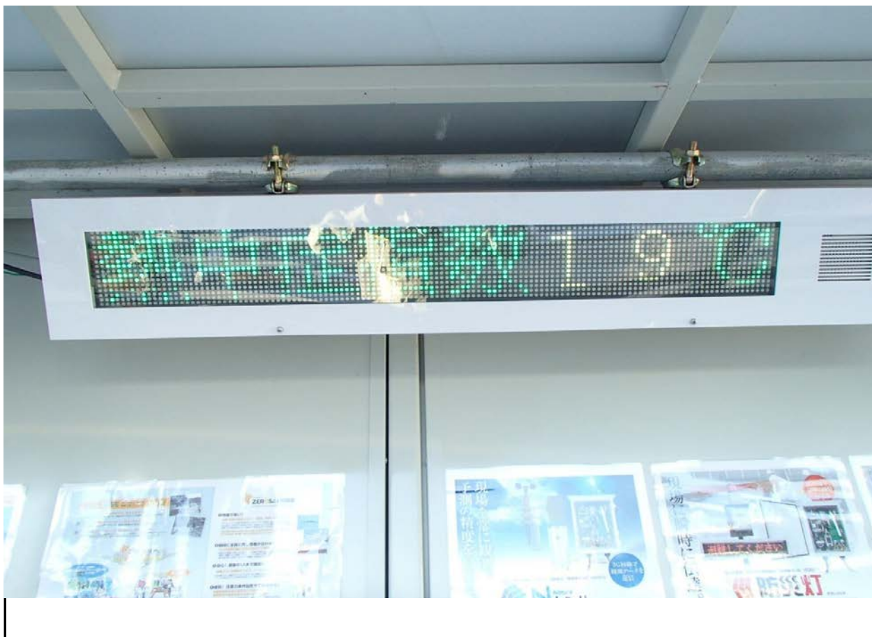
熱中症指標デジタル表示