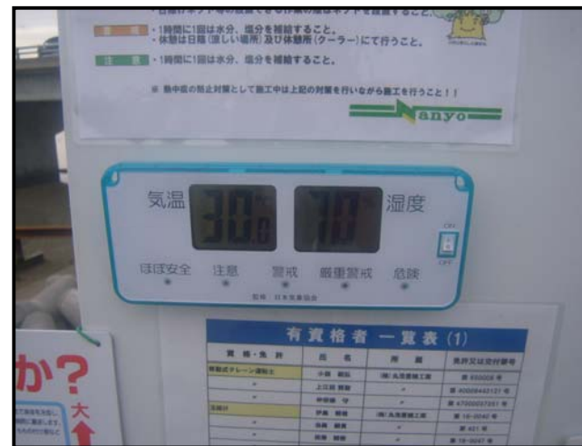
気温・湿度計の設置