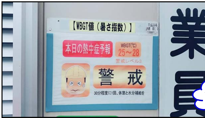
WBGT値の表示(暑さ指数)