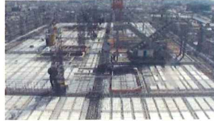
躯体施工階のアングル