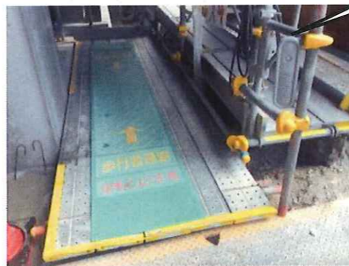
「トークナビII」(ミドリ安全・ユニット)