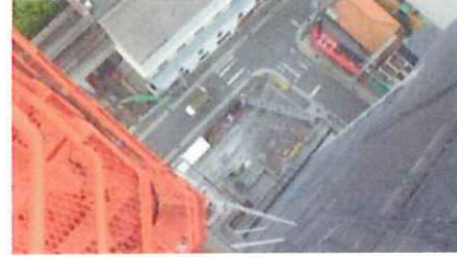
ゲート向きアングル