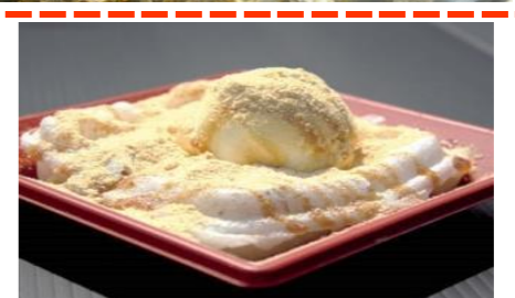
黒みつきなこアイスモッフル