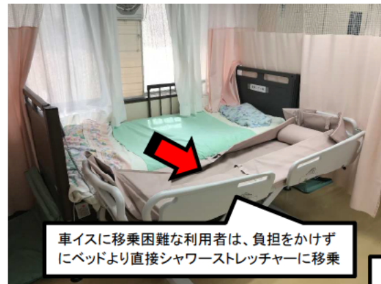
車イスに移乗困難な利用者は、負担をかけずにベッドより直接シャワーストレッチャーに移乗