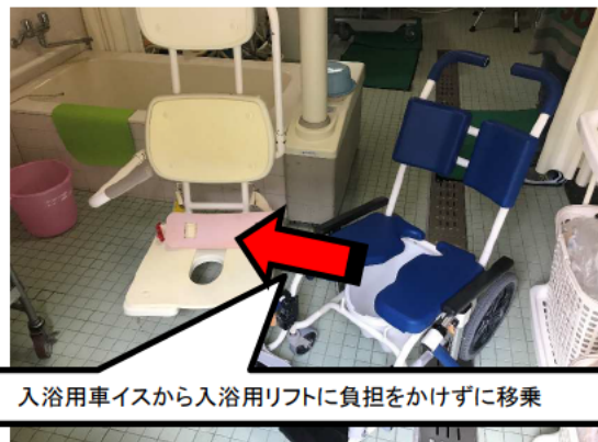
入浴用車イスから入浴用リフトに負担をかけずに移乗