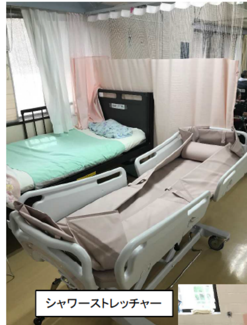
シャワーストレッチャー