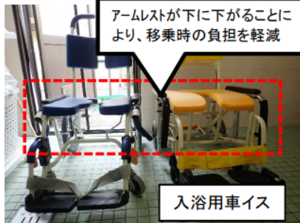
アームレストが下に下がることにより、移乗時の負担を軽減