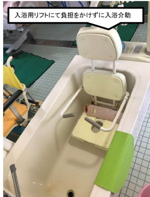
入浴用リフトにて負担をかけずに入浴介助