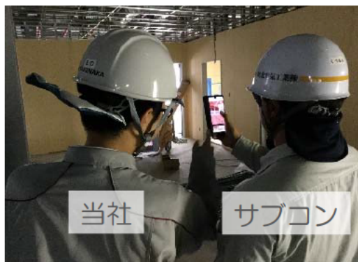
スマホで簡易にモデル確認