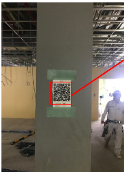
QRコード現地取付状況