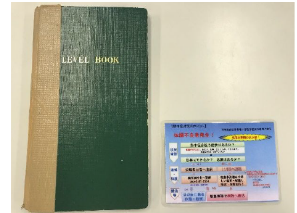
名刺サイズに縮小