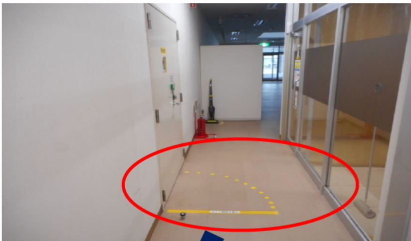
ドアの開閉範囲表示