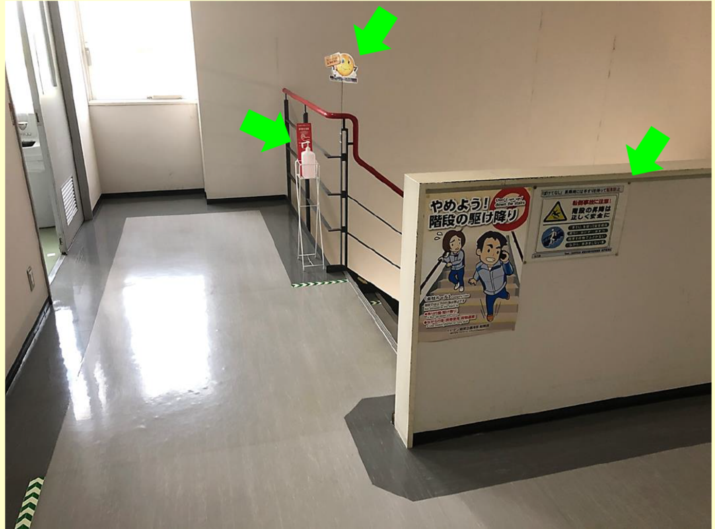
階段下り口の表示