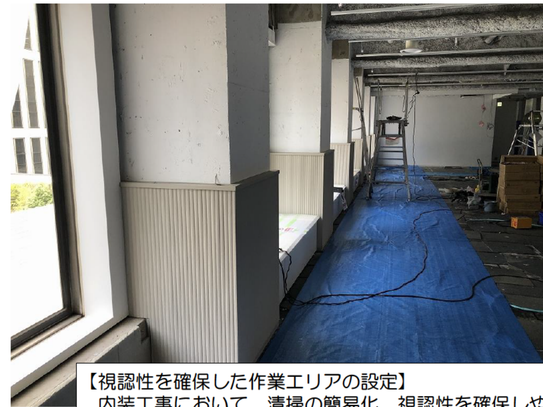
【視認性を確保した作業エリアの設定】 内装工事において、清掃の簡易化、視認性を確保しやすい様に 作業エリアはブルーシートを設置し、判りやすさに努めた。