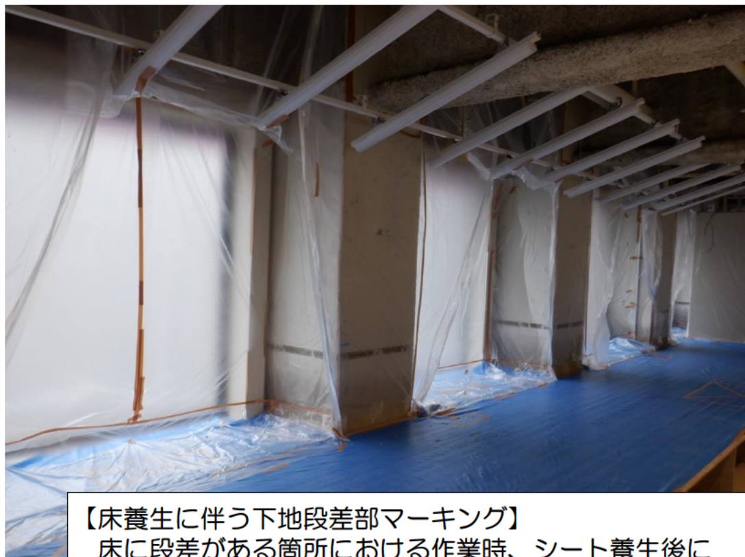
【床養生に伴う下地段差部マーキング】 床に段差がある箇所における作業時、シート養生後に 下地段差箇所（立ち馬設置不可）をテープで明示した。