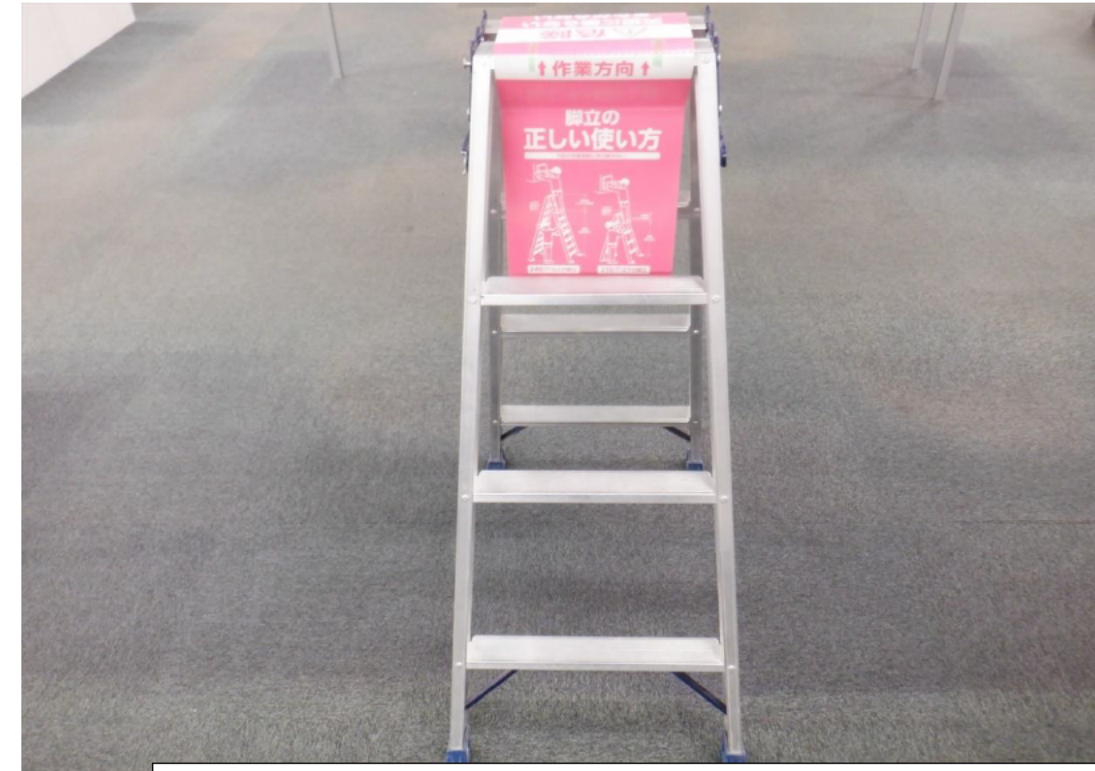
【脚立単独使用許可】 昼礼会場に脚立用POPを掲示、脚立使用許可について 現物を用いて説明実施。