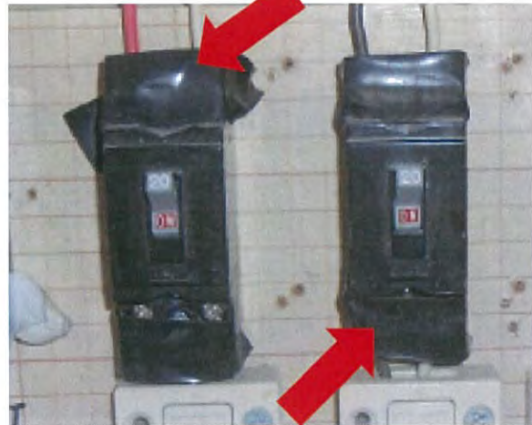
破損している端子カバーをビニルテープで補修