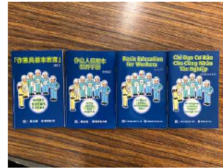
4カ国語(英語・中国語・ベトナム語・インドネシア語)を用意