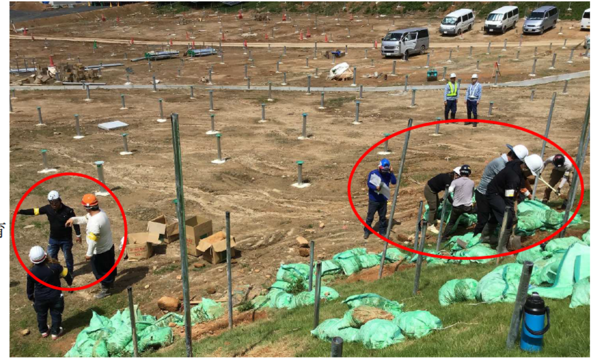
外国人労働者(白腕章)・日本人職長(黄腕章)により一目で識別