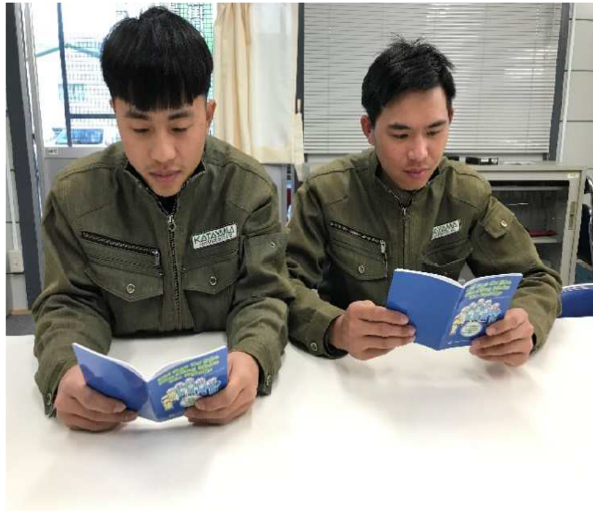
作業員基本教育小冊子による安全教育