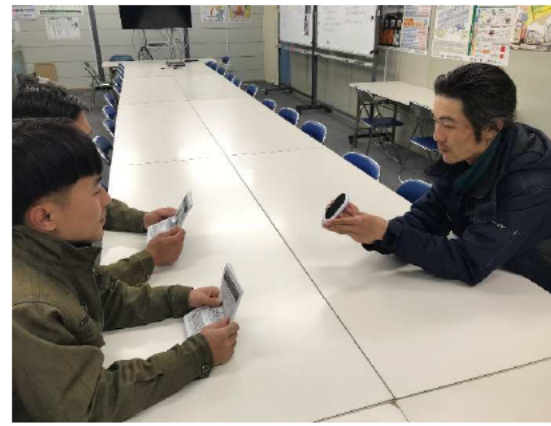
ポケットク(自動言語翻訳機)を使用した新規入場教育