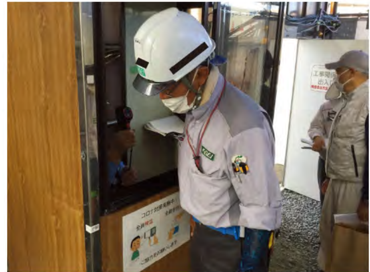
ガードマンによる検温の実施（3回/日）