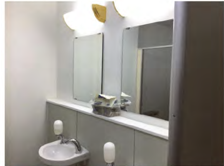
紙タオルの設置（事務所共用便所） ※ 〇〇からの申し入れにより改善した