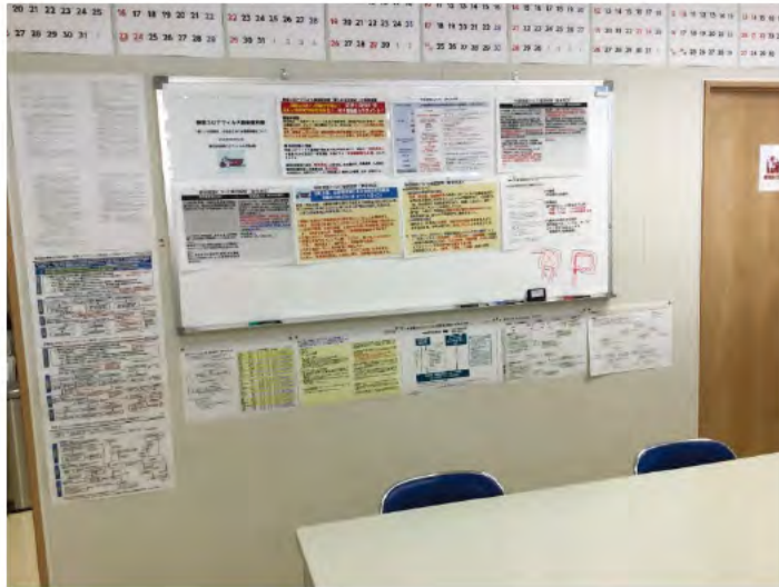
職員・作業員への周知（掲示物の充実）