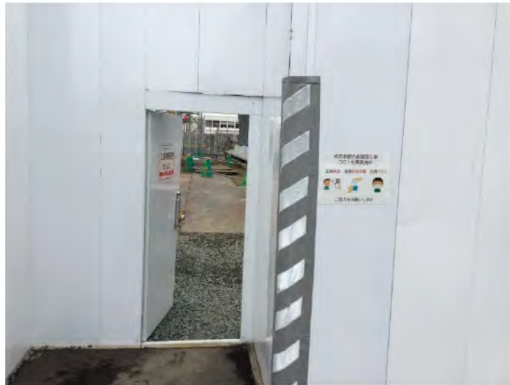
くぐり戸の開錠（ガードマン在住時）