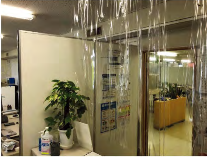
事務所受付（飛散防止カーテン設置）