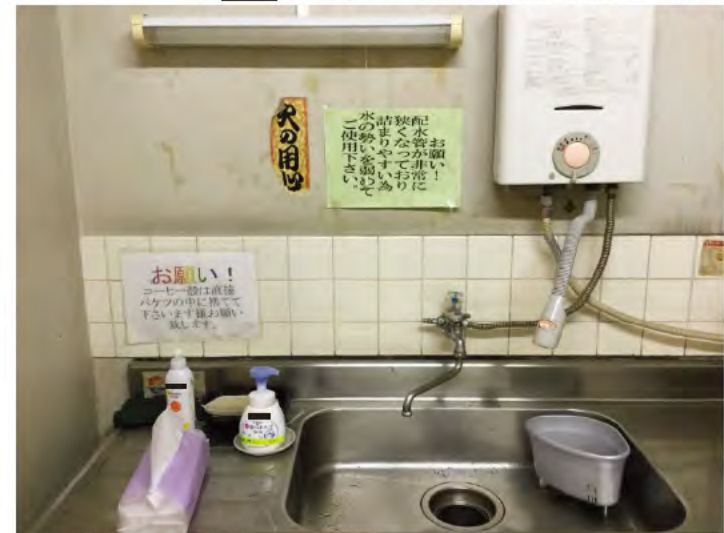
共用流し台にペーパータオル設置