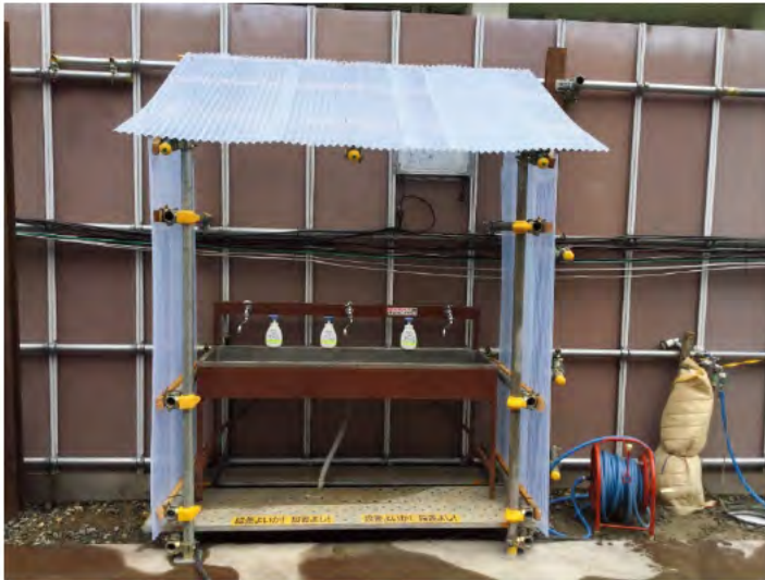
手洗い場（ハンドソープの設置）