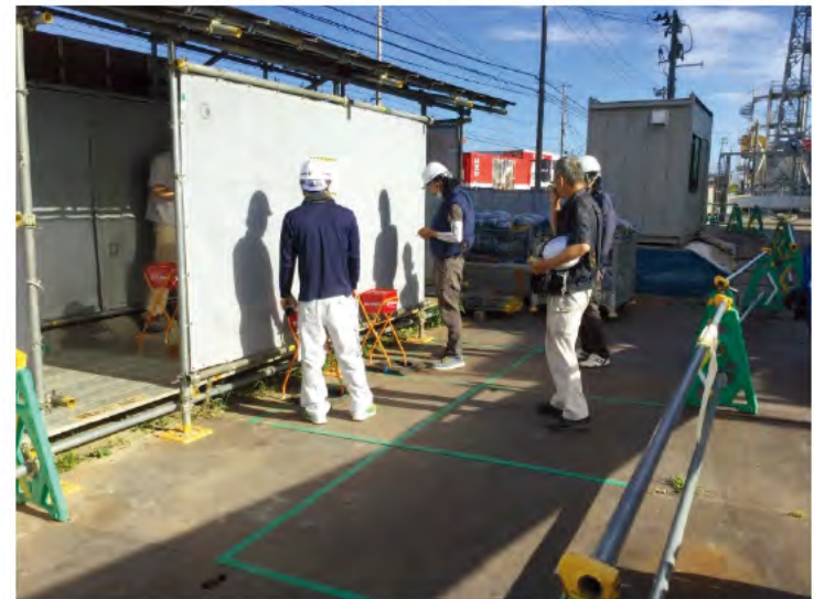
喫煙所におけるソーシャルディスタンス