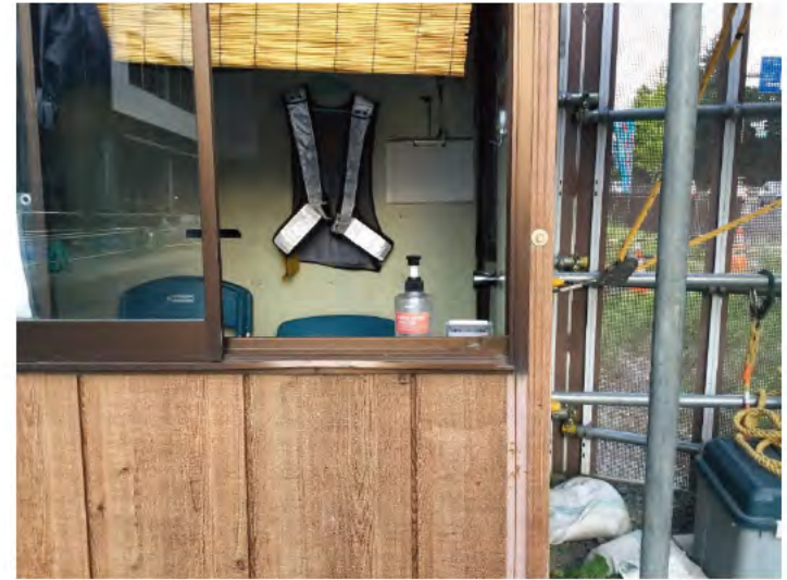
ガードマンBOX（緊急来庁者用アルコール設置）