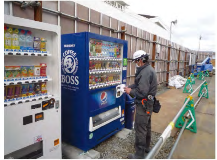
リーダー会による定期的な除菌