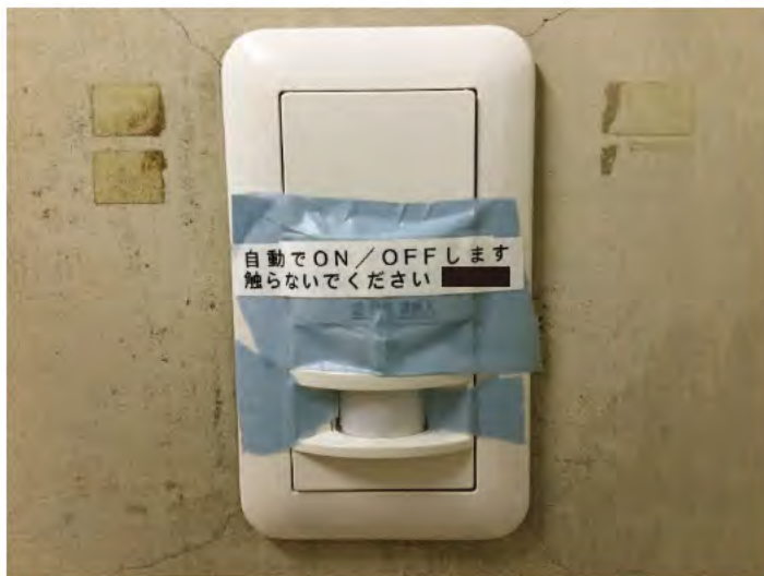
共用流し台に人感センサー設置