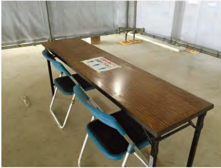
現場内休憩所におけるソーシャルディスタンス