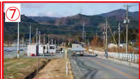
富岡町のスクリーニング場 車両出入り有り、注意！