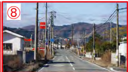
ガソリンスタンド営業中 車両出入り有り、注意！