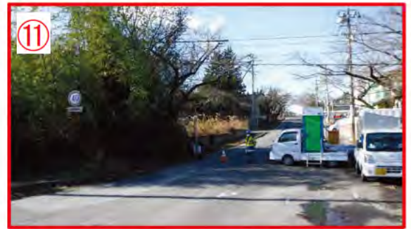
⑪ 夜の森 工事用ゲート付近。 [redacted] の工事関連車両が通行する。身分証、通行許可証確認。