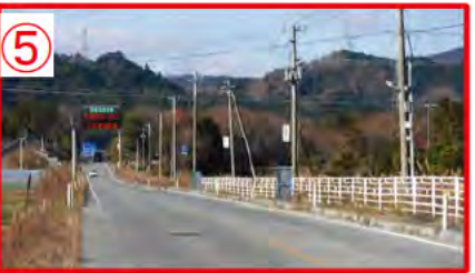
⑤ 富岡 I C 入口付近。直線だが交通量多い。制限速度 50 km/h