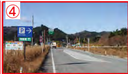
④ 富岡 I C 入口付近