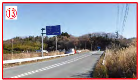
⑬ 県道36号と国道6号の交差点。大型車の通行多い。富岡ICから県道を経由し国道6号へ出る場所となる。