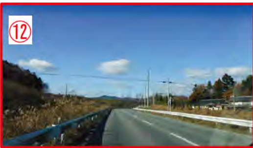
⑫ 直線後に急カーブが連続する！工事車両多く危険。通行注意！