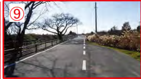
大型車通行多し。桜並木は、桜の時期は美しく 観光客の方々の路上駐車がある。工事車両の通行は慎重に！