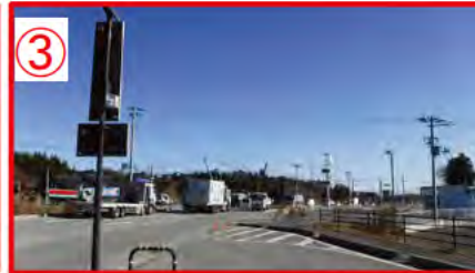
③ 県道36号線と35号線の交差点交通量が多い。