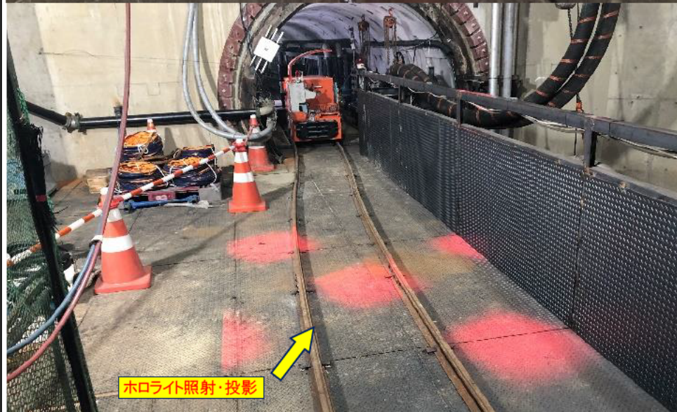
←立入禁止エリアの 投影状況