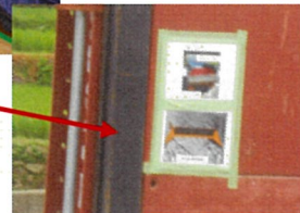
オペレーターへの周知確認のため 運転席と積み込み場所にも表示