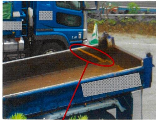
荷台のこぼれ防止ポケットライン