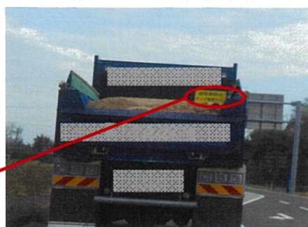
過積載防止の積載天端表示の例