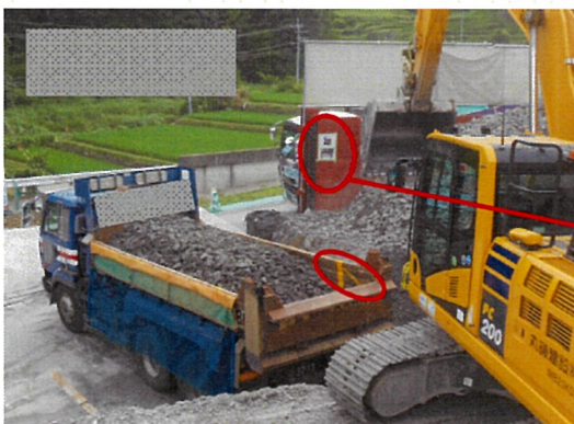
BHオペがこぼれ防止ポケットライン内に納まるように積み込み