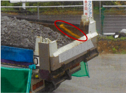
こぼれ防止ポケットライン内積荷で運搬

ダンプ過積載量の目安(下段※印)と運搬時のこぼれ防止対策はありますが積み込むBHオペレーターと運ぶダンプ運転手や管理する者と仕事に分かれているので管理し難い部分でした。誰が見ても分かるように「こぼれ防止ポケットライン」を明示しました。