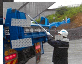
点検鏡で不安定な荷と 全体荷姿を目視確認

※ダンプ過積載量の目安では土砂及び碎石・アスファルト合材等の建設資材は均した状態で平ボディの嵩高さいっぱいまでとありますので右写真のようなダンプ積載ラインが一般的です。