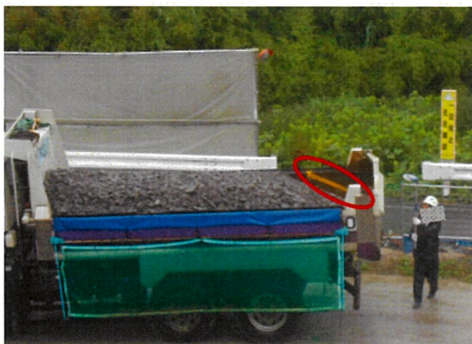
監視員が点検鏡でこぼれ防止ポケットラインを確認