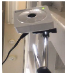
小型のWebカメラをセットしF3管制室のモニターで監視（人が居ないか）