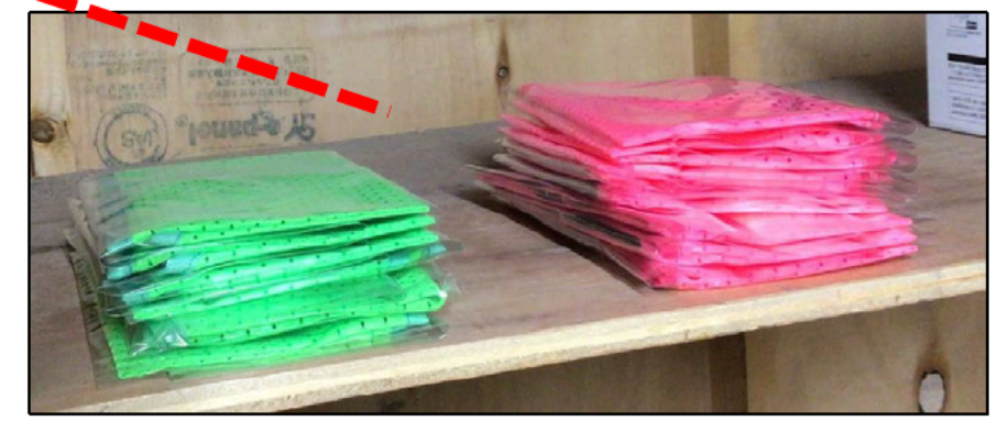
ピンクの防暑たれ