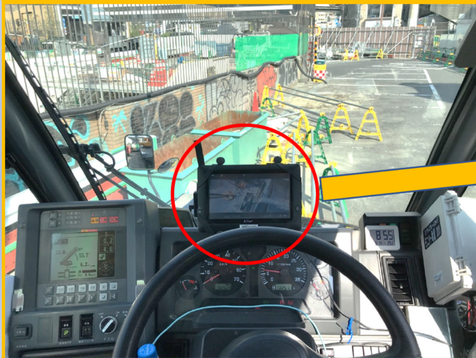
運転席でのモニタの映像

地下へ(から)の揚重作業時には玉掛け(外し)者が直接目視できないため、boom先端に取付けたカメラの映像を運転席のモニタで確認することで不安全作業を排除する