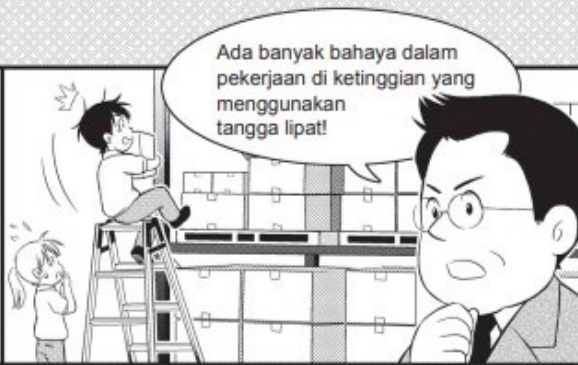
Contoh kecelakaan kerja yang mudah terjadi akibat tangga dan penanggulangannya