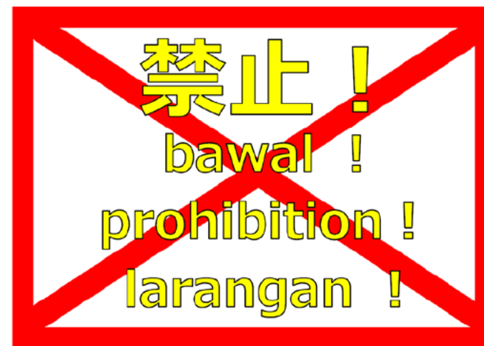
(例) 注意喚起の看板