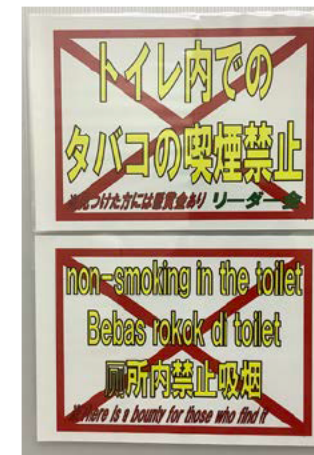
現場運用中の看板