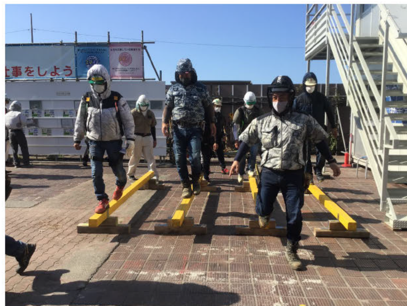
写真 平均台による健康状態確認実施状況

当作業所では、熱中症予防対策として朝礼後に全作業員に平均台を歩行してもらい、各作業員の健康状態を「見える化」している。 健康状態が不良であれば、平均台でもたついたり、落下することから、万一疑わしい者がいれば、個別に健康状態の確認を実施している。