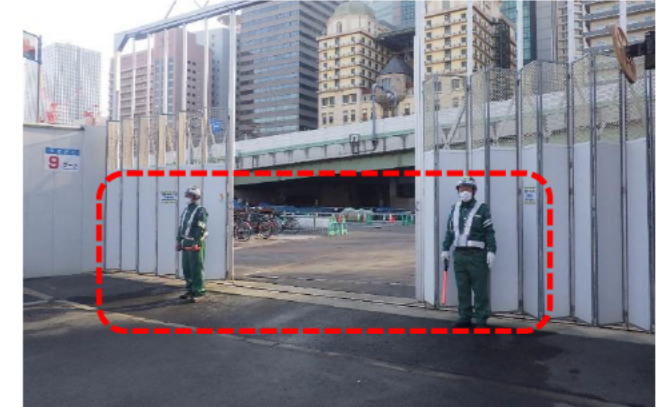
各ゲート警備員立哨