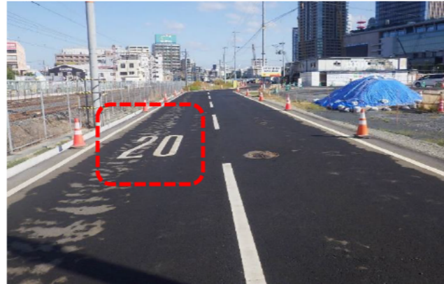
工事用道路制限速度表示