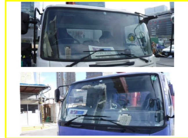
フロントガラス付近の整理整頓