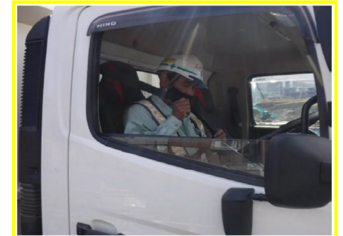
シートベルトの着用