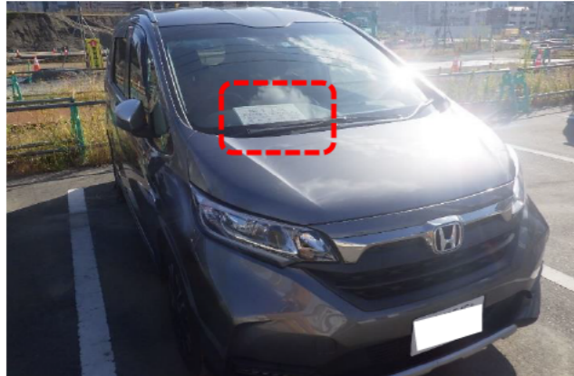
通勤車両許可看板明示