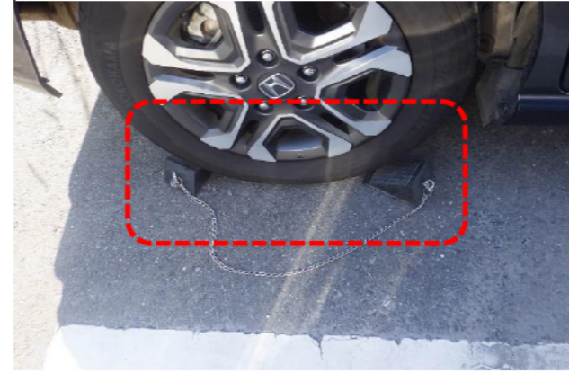
通勤車両も停車したら歯止め