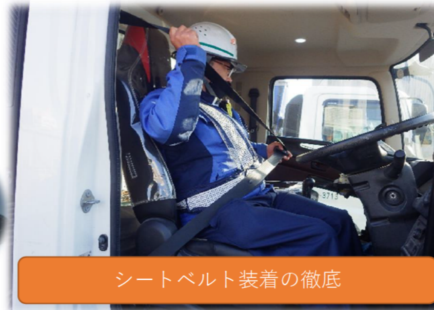
シートベルト装着の徹底