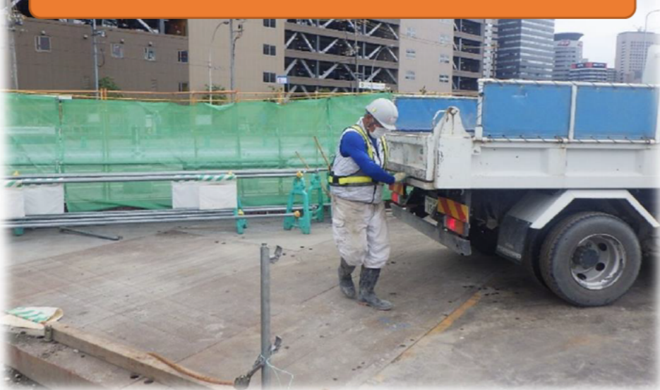
ダンプ走行前、後部の確認・清掃