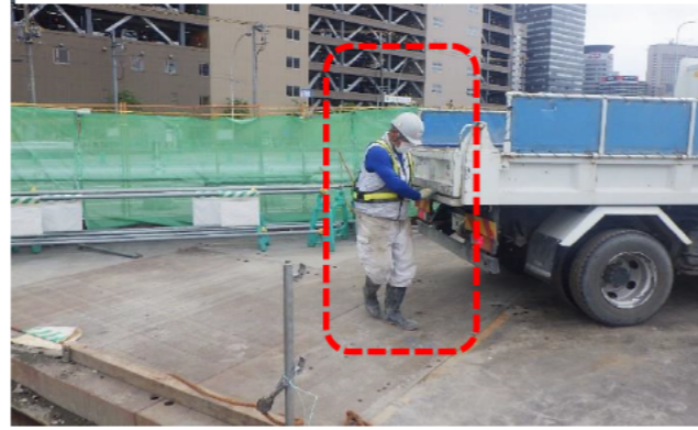
工事車両後方残土清掃指示