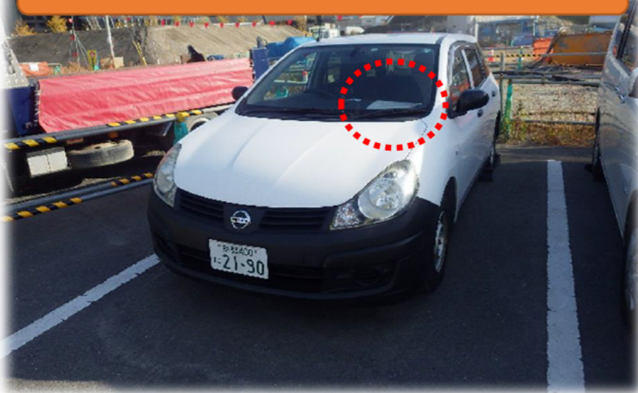
車両使用者の明示