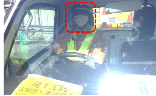
ながらスマホ禁止