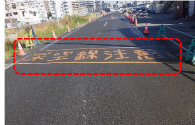
工事用道路架空線注意表示