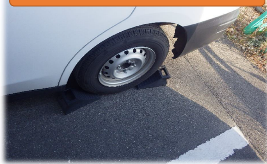
車両留置時の歯止め設置確認