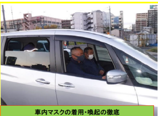
通勤車両内 感染対策の実施