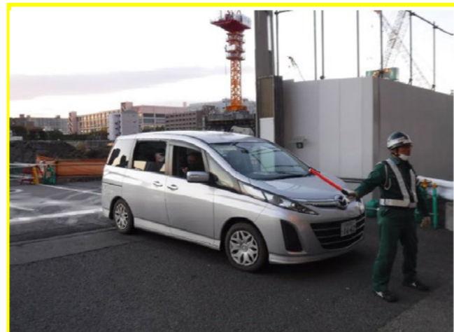
工所用ゲート出入り時、左右確認