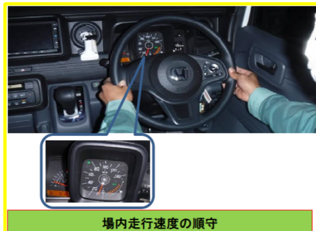
現場内ルールへの順守