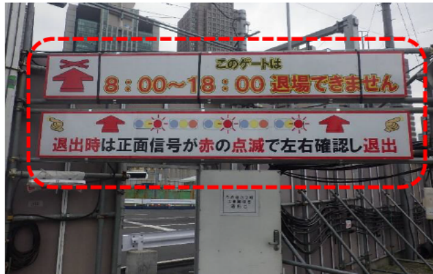
ゲートに見える化看板設置