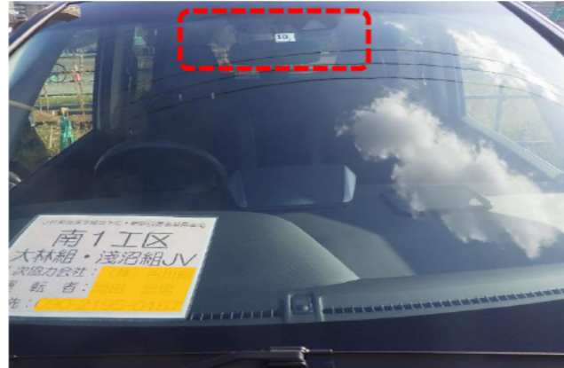
通勤車両ドライブレコーダー設置車両のみ