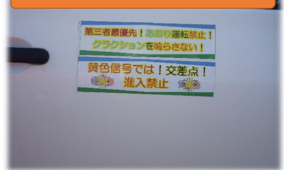
運転時の心得明示による注意喚起