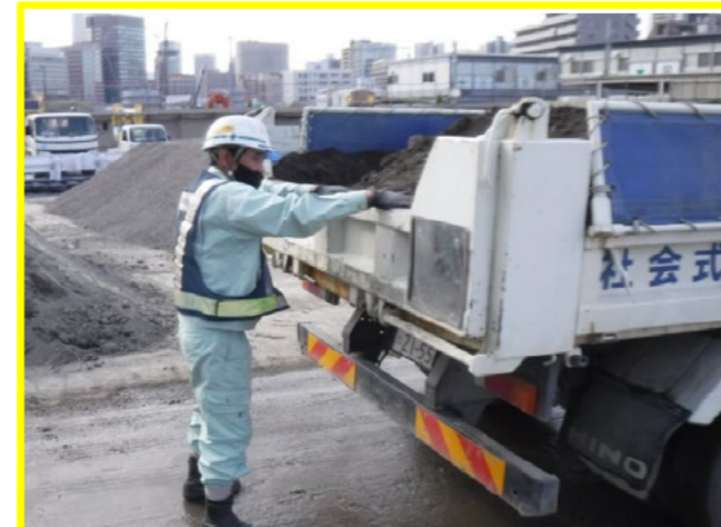
工事車両後方残土の確認