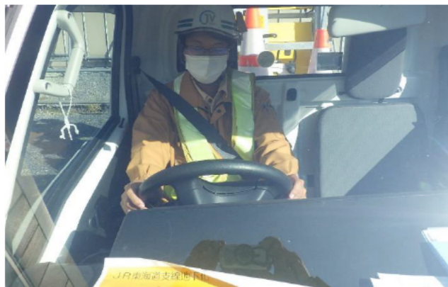
シートベルト使用徹底