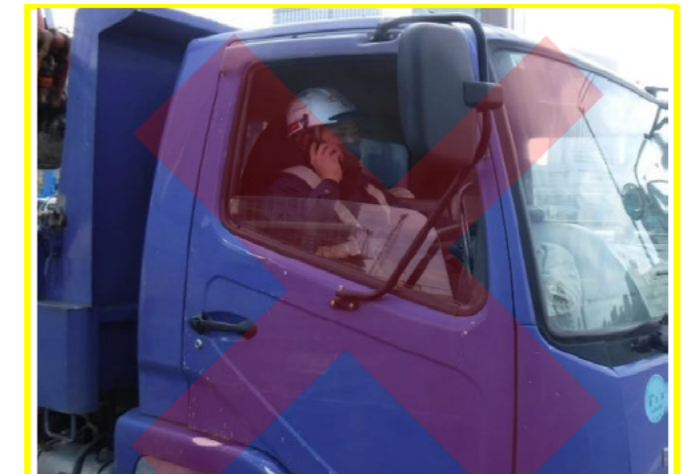
運転中、携帯電話の使用禁止