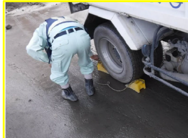
停車したら歯止めの実施