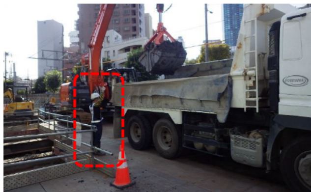
車両誘導徹底指示