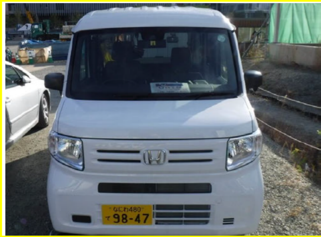
通勤車両許可証明示