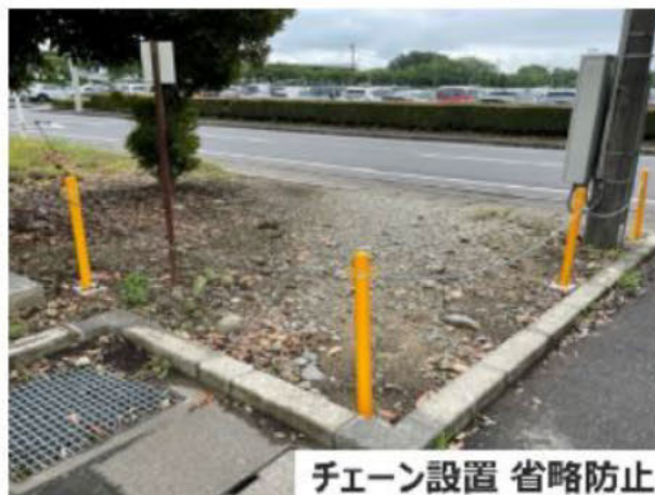
チェーン設置 省略防止