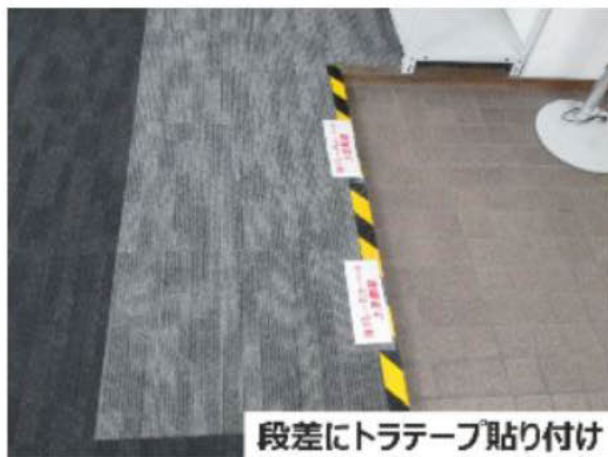
段差にトラテープ貼り付け