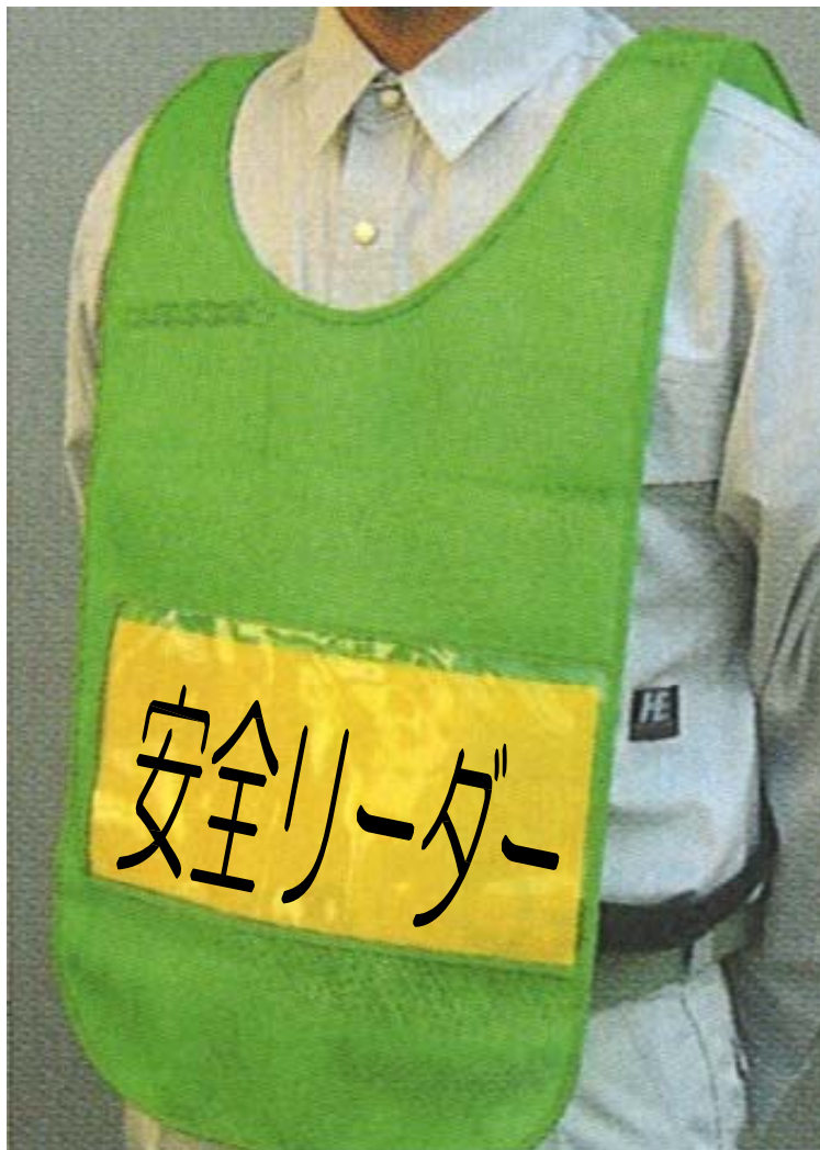
安全リーダーチョッキ