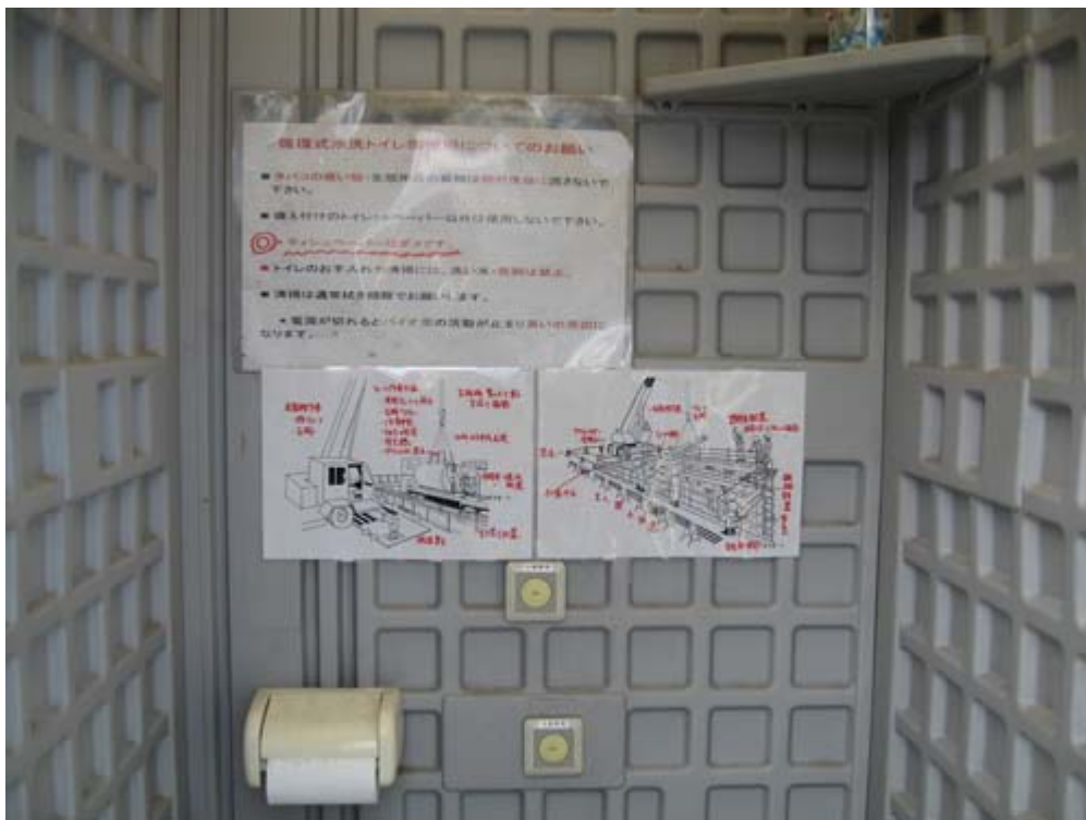
危険作業に対するポイントを掲示