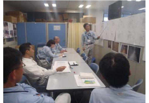
図① 所内検討会の様子