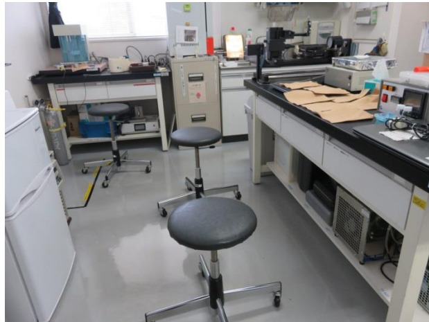
出しっぱなしで通行の妨げに

実験室等に複数ある丸イスが、出しっぱなしになっていてつまづくことが多発していた。 誰もがわかるように「しまう場所」を決めたら、戻すようになりつまづくことが無くなった